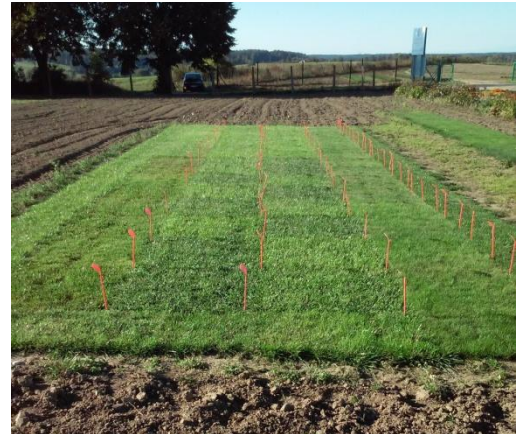
Fot. 11. Doświadczenie gazonowe (życica trwała, kostrzewa trzcinowa, kostrzewa czerwona)