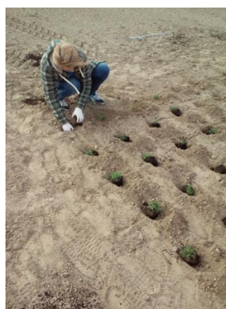
Fot. 10. Pojedynki roślin przygotowane do sadzenia