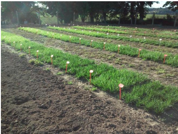
Fot. 12. Doświadczenie pastewne kupkówki pospolitej i kostrzewy trzcinowej (siew I dekada lipca, skoszone 18.09.2015)