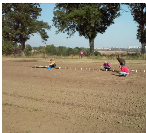
Fot. 9. Sadzenie szkółki życicy mieszańcowej GALA