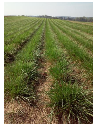
Fot. 7. Plantacja kostrzewy trzcinowej RAHELA (4 rok użytkowania)