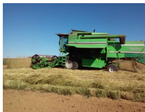
Fot. 8. Zbiór perzu wydłużonego BAMAR