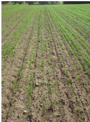
Fot. 2. Plantacja życicy trwałej STADION (siew I dekada września)