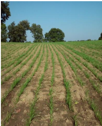
Fot. 1. Plantacja życicy westerwoldzkiej KOGA (siew I dekada września)