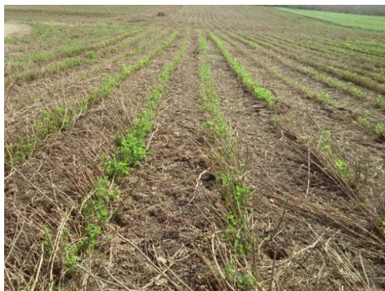
Fot. 5. Odrost lucerny mieszańcowej RADIUS (plantacja desykowana przed zbiorem)