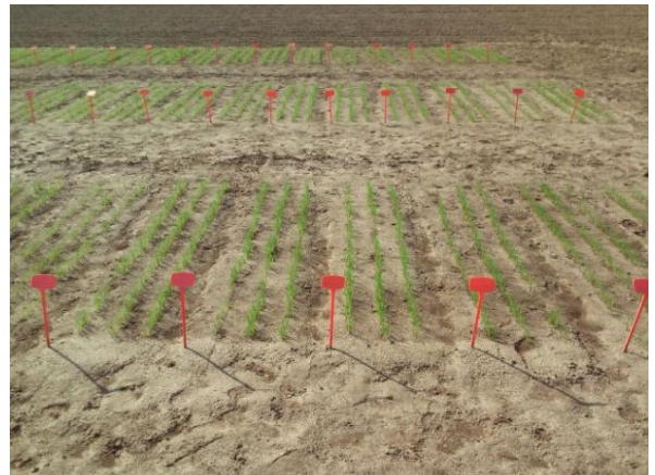
Fot. 13. Doświadczenie pastewne życicy wielokwiatowej (siew 4.09.2015)