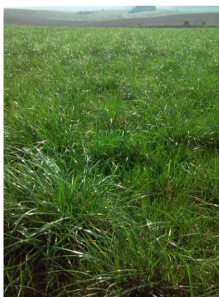
Fot. 6. Plantacja kostrzewy łąkowej PASJA (2 rok użytkowania)