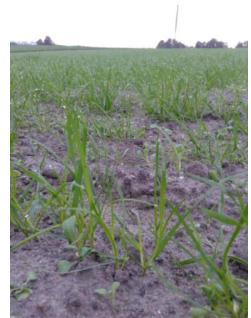
Fot. 4. Stan zachwaszczenia na plantacji życicy trwałej BOKSER (siew III dekada sierpnia)